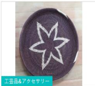
工芸品&アクセサリ