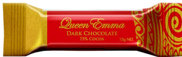
Dark Chocolate 15g