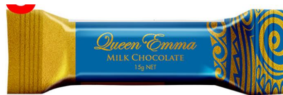
Milk Chocolate 15g