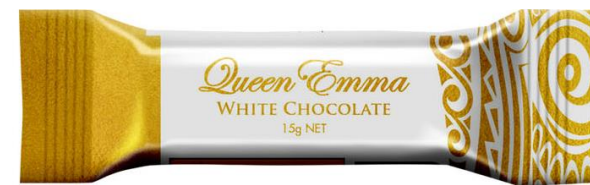
White Chocolate 15g